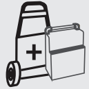
Vagn 31 x 55 x 93 cm 45,5 kg