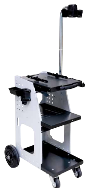
ref. 051331 + 052284 UNIVERSAL 800 + кронштейн