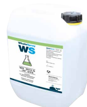
ref. 062511 специальная сварочная охлаждающая жидкость - 5 л