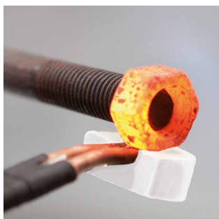
Устранение заедания болтов