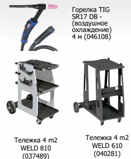
Тележка 4 м2 WELD 810 (037489)