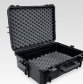
Cutie de transport IP67 060432