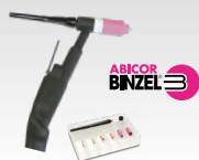
SR26L - 8 m 046184