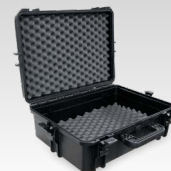
On-site deksel IP67 060432