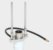
Gaffel med gassskjerming 068346