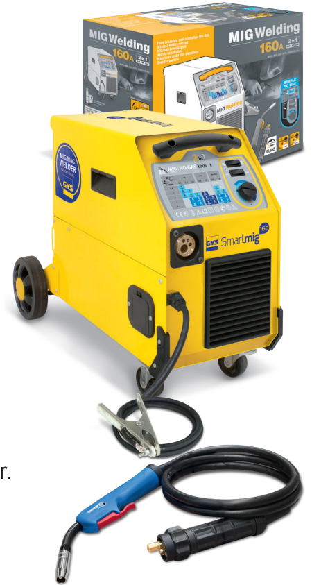
Geleverd met massakabel en demontabele toorts van 2,2m.

Bescherming tegen oververhitting door een ingebouwde Ventilator.