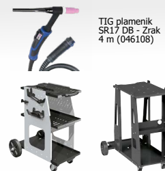
KOLICA 4m 3 ZAVARIVANJE 810 (037489)