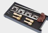
Kutija s potrošnim materijalom za ARCPULL 700 068322