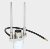
Vilica sa zaštitom od plina 068346