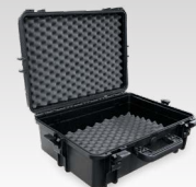
Kohapealne korpus IP67 060432