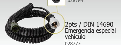
2pts / DIN 14690 Emergencia especial vehículo 028777