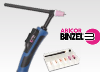
SR26DB - 4 m 038271