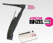
SR26L - 8 m 046184