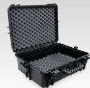
Θήκη επιτόπου IP67 060432