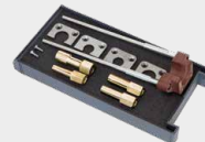
Æske med forbrugsvarer til ARCPULL 700 068322