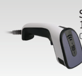
Strekkodelæser 1D/2D 027718