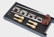
Кутия с консумативи за ДЪГОВА СПИРАЛА 700 068322