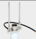
Вилца с газова защита 068346