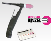
SR26L - 8 м 046184