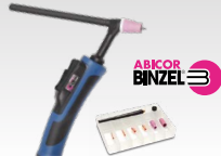
SR26DB - 4 м 038271