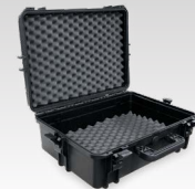
Корпус для установки на місці IP67 060432