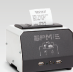
SPM : Skrivarmodul 026919