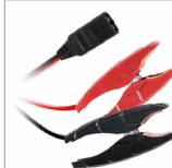
Svorky (35 cm)