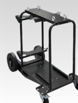
Vozík 10 m 3 039711