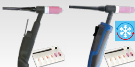
SR26 L 046184