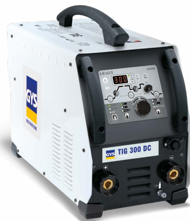
Dodáva sa bez príslušenstva

■ AIP (Adjust Ideal Position) : pomáha nastaviť polohu horáka pred zvaraním (režimy 4T a 4T LOG).