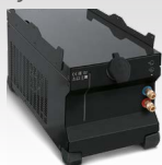
WCU 1kW B 032217