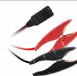
Cleme (35 cm)