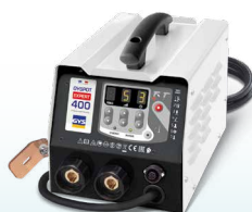
PROLINER PRO 230 - ref. 035799 PROLINER PRO 400 - ref. 035805