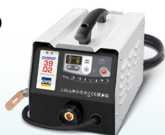
PROLINER 39.02 - ref. 035775 PROLINER 39.04 - ref. 035782