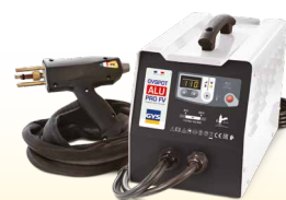
PROLINER ALU PRO FV - ref. 035836