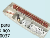
Caixa de acessórios para desamolar ao aço ref. 050037