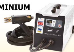
PROLINER ALU PRO FV - ref. 035836