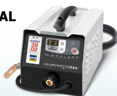
PROLINER 39.02 - ref. 035775 PROLINER 39.04 - ref. 035782