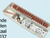
Doos met aanvullende onderdelen uitdeukwerkzaamheden staal ref. 050037