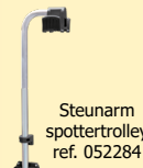
Steunarm spottertrolley ref. 052284