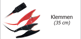
Klemmen (35 cm)