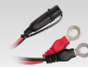
Enģu savienotājs 45 cm - M6 029194