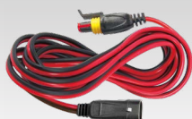
Pagarinājums 2,5 m - 029057