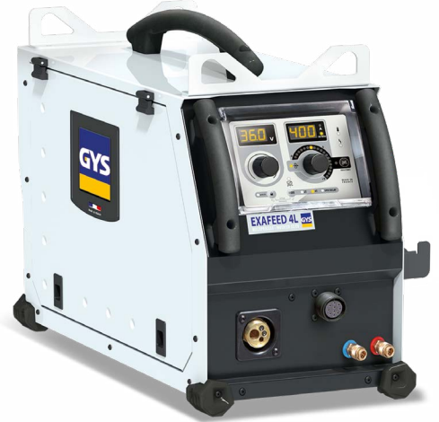
Tiekiami be priedų