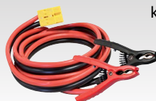
2,5 m - 16 mm 2 056503 5 m - 16 mm 2 054615 8 m - 16 mm 2 056572