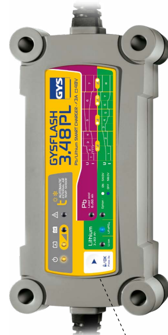
Interfaccia di blocco