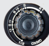
Teinte 5>13 et mode meulage