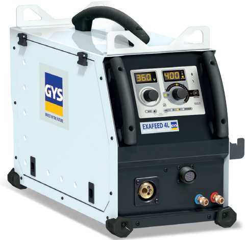
Livré sans accessoires