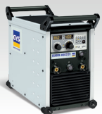
EXAGON 400 010925