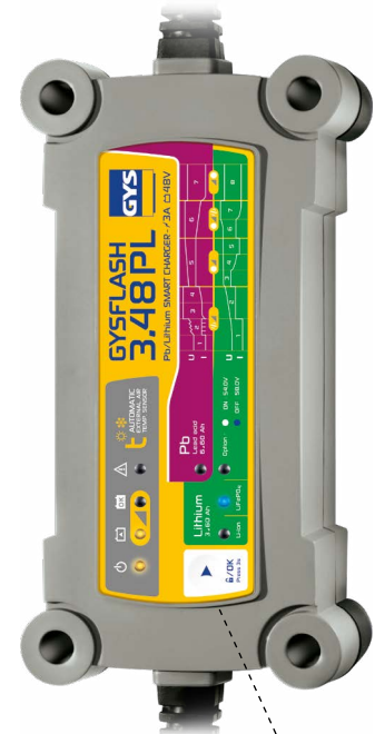
Interface de verrouillage