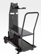
Käru PN. 041257