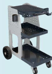
Spot 800 káru ref. 051331