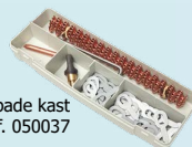
Terasest tarbekaupade kast ref. 050037