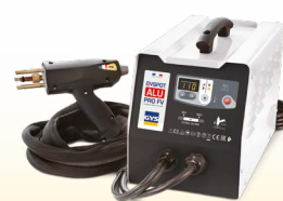
PROLINER ALU PRO FV - ref. 035836