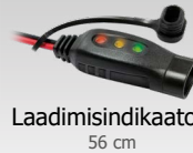
Laadimisindikaator 56 cm