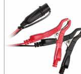
Klambrid (45 cm)