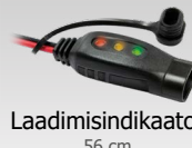
Laadimisindikaator 56 cm