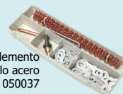
Caja de complemento para desabollo acero Ref. 050037