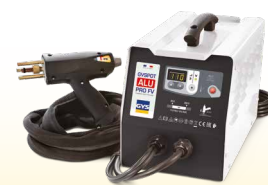
PROLINER ALU PRO FV - ref. 035836