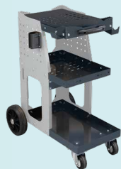
Carrito Spot 800 ref. 051331