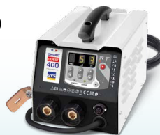
PROLINER PRO 230 - ref. 035799 PROLINER PRO 400 - ref. 035805