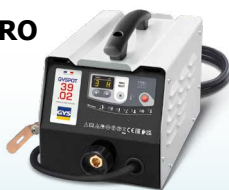
PROLINER 39.02 - ref. 035775 PROLINER 39.04 - ref. 035782