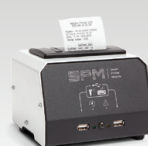
SPM : Módulo impresora 026919