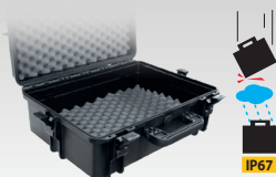
Maletín de transporte 060432