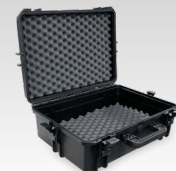
Θήκη επιτόπου IP67 060432