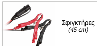
Σφιγκτήρες (45 cm)