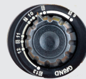
Farbe 5>13 und Schleifmodus