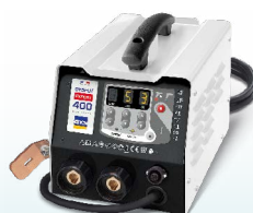
PROLINER PRO 230 - ref. 035799 PROLINER PRO 400 - ref. 035805