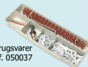
Stålkasse til forbrugsvarer ref. 050037