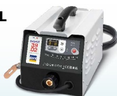
PROLINER 39.02 - ref. 035775 PROLINER 39.04 - ref. 035782