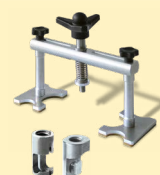
Alu aftrækker ref. 051003